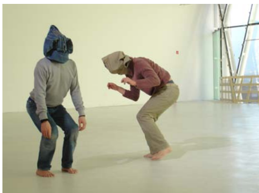
Otomo / © Sandra Neveut