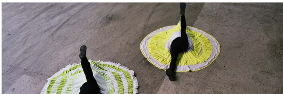
Faire Diversion , 2008